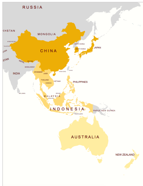
Carte 1 – Les pays membres du RCEP

Source : MapChart - https://mapchart.net/ Mise en forme par Asia Centre